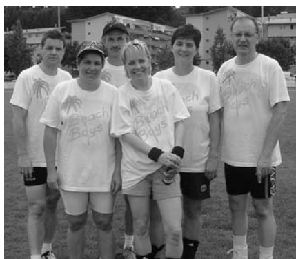
Volley-Plausch-Turnier, 27. Juni 2004