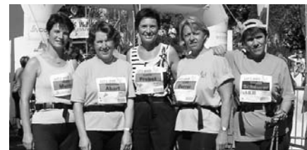
Walking-Event Solothurn, 5. September 2004