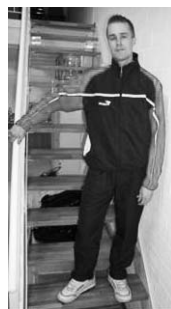
Der «erste» Vereins-Trainingsanzug ist Tatsache geworden!