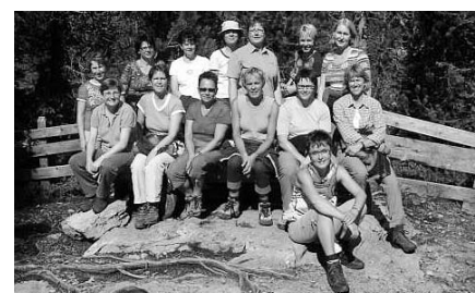
Fitness, Berner Oberland, 13. – 14. August 2004