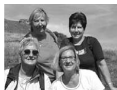
Frauen-Wanderung Savognin, 19. September 2004