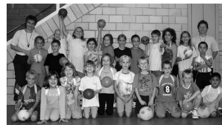
Ball & Spiele