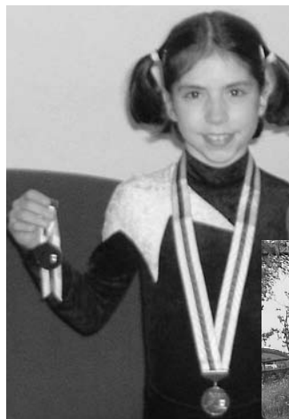
Junge Rotkreuzer Geräte-turnerInnen/Leichtathlet-Innen 2004 erfolgreich – zum Teil sehr erfolgreich!