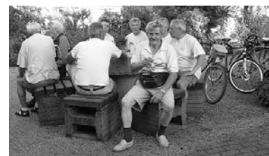
Radsternfahrt, 9. Juni 2004