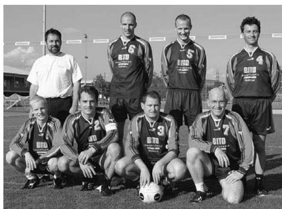
Rotkreuzer Faustballer Team 1

Neben dem normalen Trainingsbetrieb montagabends von 20.30–22.00 Uhr in der Waldegghalle waren die Männer unter anderem auch wettkampfmässig aktiv. «Wintermeisterschaft» im Volleyball, Mixed-Plauschturnier, Männerriegentag mit Volleyball- und Unihockeyturnier, usw.