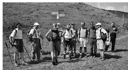
Mörlalp, 28.–29. August 2004

Neben dem normalen Trainingsbetrieb montagabends von 20.30–22.00 Uhr in der Waldegghalle waren die Männer unter anderem auch wettkampfmässig aktiv. «Wintermeisterschaft» im Volleyball, Mixed-Plauschturnier, Männerriegentag mit Volleyball- und Unihockeyturnier, usw.