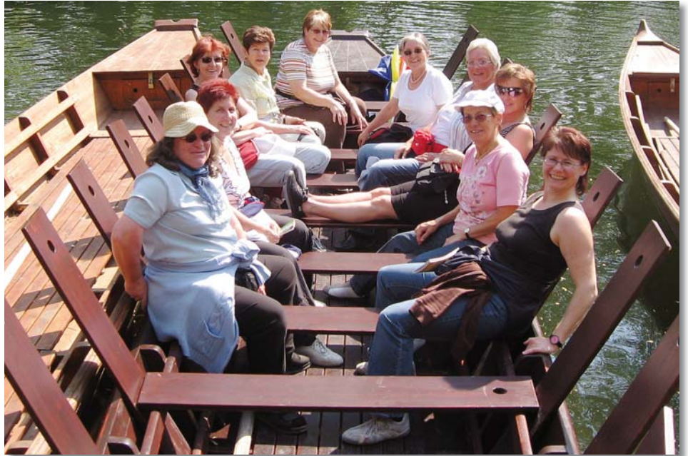
Frühlingsfahrt der Montags-Frauen nach Tübingen.

Nach dem langen Warten und Vorbereiten war es im Juni endlich soweit. Zwei Teams der Damenriege reisten ans eidgenössische Turnfest nach Frauenfeld. Eine Volleyballmannschaft, nahm an einem der vielen Volleyballturniere teil. In der Kategorie Fit & Fun mass sich eine Mixed-Gruppe mit anderen Teams aus der ganzen Schweiz. Am Abend war dann Ramba Zamba angesagt und alle genossen das vielfältige Angebot. Die Teilnahme am prächtigen Umzug war Ehrensache: stolz durfte unsere Fahnen-trägerin die Riegenfahne präsentieren. Ein krönender Abschluss bot sich für alle Teilnehmenden mit dem Empfang in Rotkreuz und der schönen Zeremonie auf dem Dor-mattplatz.