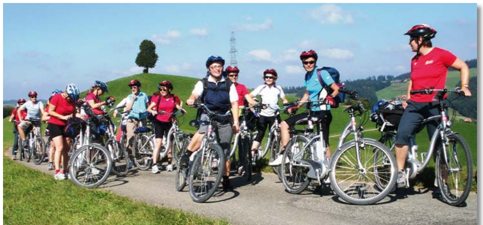
Die Aerobic-, Volleyball- und Fitnessgruppe auf Elektro-Bikes im Emmental.

Die Aerobic-, Volleyball- und Fitnessgruppe wurde dieses Jahr ins Emmental ent-führt. Mit Elektro-Bikes führte der Weg von Hasle-Rüegsau über das hügelige Emmental vorbei an wunderschönen Bauernhöfen nach Willisau. Viel Spass machte das flotte Tempo. Nach einem gemütlichen Nachtes-sen und Übernachtung auf dem Bauernhof ging es am Sonntag weiter zu einer inter-essanten Führung in die Schaukäserei in Afoltern im Emmental.