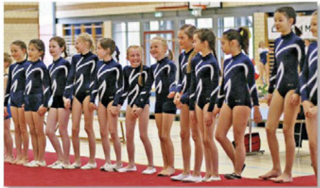
oben K1-Turnerinnen am Waldmaa-Cup in Baar unten TSG 2019 Malmö