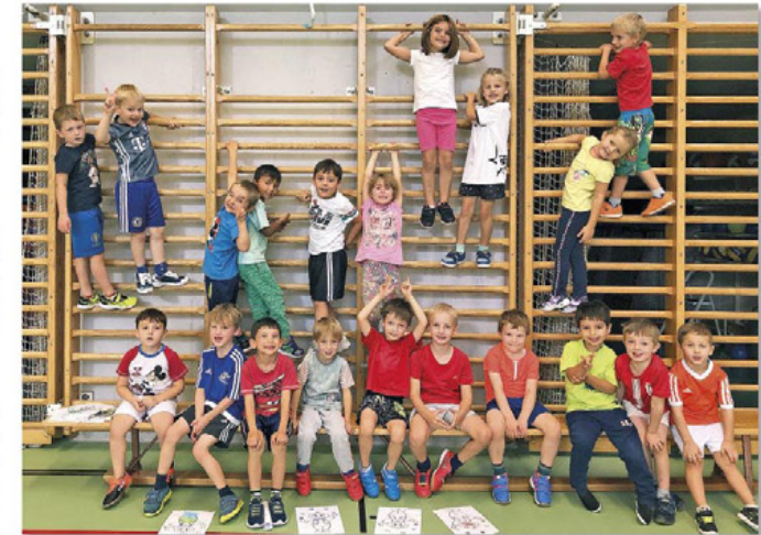
Bilder und Text Dereny Amlehn

Das Kitu ist für Erst- und Zweit-Kindergärtner, nach den J+S-Leitlinien «LERNEN-LEISTEN-LACHEN» aufgebaut und die Lektionen finden, je nach Wetter, drinnen oder draussen statt.