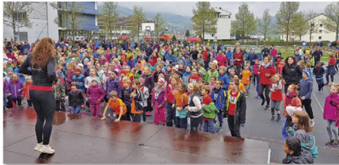
Jugitag, 12. Mai 2019, Unterägeri